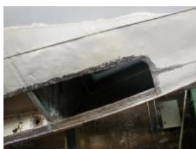
on découpe la coque