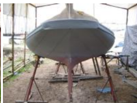
La coque vue de l'arrière