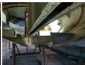
découpe coque puits de dérive