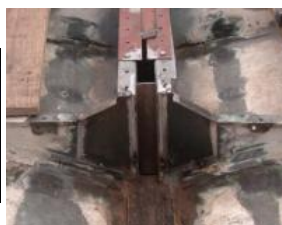
soudure de l'arrière du puits de dérive