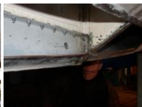
on remonte le puits