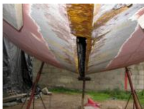
Vétille avant travaux

Vétille a repris ses navigations en participant aux Rendez-vous de l'Erdre fin août 2012, aux Journées du Patrimoine le 16 septembre et aux régates de Trentemoult le 23 septembre