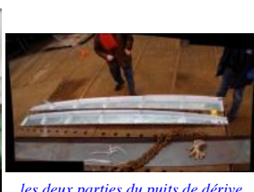
les deux parties du puits de dérive