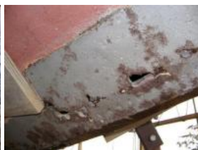
coffre avant tribord