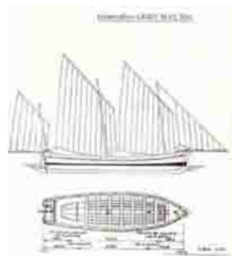
Le Cap Cepet

Il s'agit d'un canot à avirons et à voile de 10.5m, coque et mature en bois, construit par le Chantier de la Garonne à Bordeaux en 1955, déplacement 2,43 tonnes, et disposant de 3 mâts au tiers pour 4 voiles: GV, misaine, tapecul et foc établies respectivement sur une queue-de-malet et un bout-dehors. La surface de voilure, 54,30m 2 , est ainsi répartie : Gv de 19,20 m 2 , misaine de 17,50 m 2 , tapecul de 7,80 m 2 , foc de 4,90 m 2 , voile d'étai de 4,90 m 2 . L'équipage comprend 16 rameurs en 8 rangs de 2.