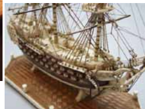
modèle de ponton

Nous participons aux publications d'AMERAMI depuis plusieurs années et nous le faisons avec beaucoup de plaisir: nous trouvons ce travail absolument remarquable.