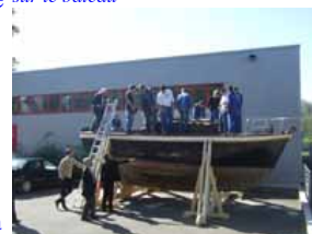
Les restaurateurs sur le bateau