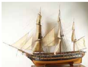
Modèle arsenal de la Charlotte