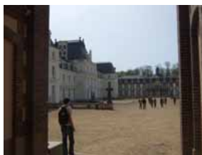
le chateau des Vaux