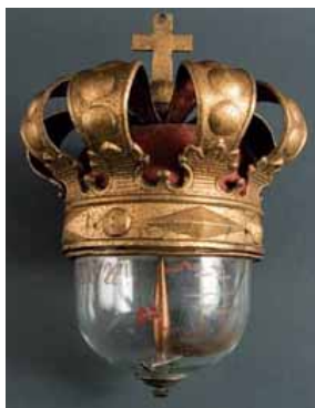
extraordinaire compas inversé