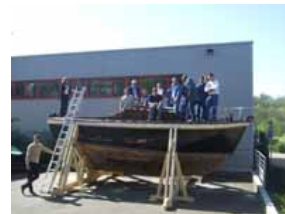
autre vue des restaurateurs sur le bateau