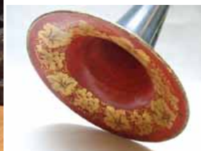
Porte voix du canot de Louis Philippe