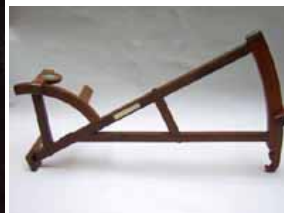
Quartier de Davies