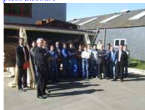
L'équipe de restauration de la Fondation d'Auteuil