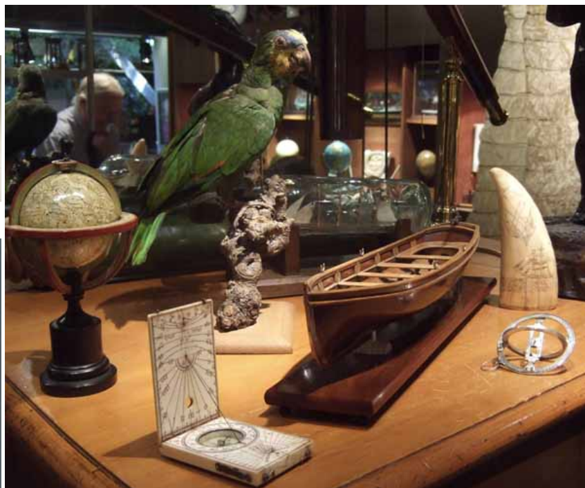
L' amateur de marine...