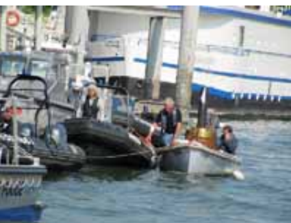
la Vigie au sein de la Brigade Fluviale

semblant d'habitude pour cette opération ? Aussitôt à l'eau nous posons la cheminée et « éclairons » la chaudière déjà remplie d'eau. Il est 12h45. Trente minutes après, le manomètre affiche 10 bars et un peu moins de 20 kg de bois ont été nécessaires pour atteindre le timbre. Comme nous avons changé l'hélice, objet de cet essai, la marche est inversée et la machine retrouve son rythme britannique. Ouverture du régulateur, les quatre purges crachent leur vapeur consommée, première giration et marche en direction du Bassin de la Villette.