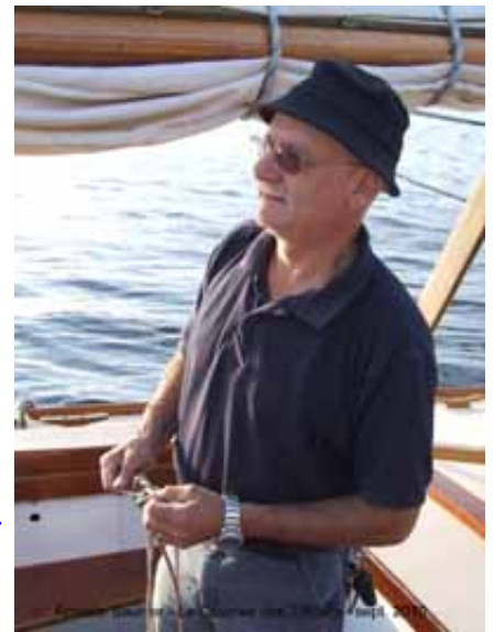
un skipper satisfait...

Les Yachts d'Époque, Classiques et d'esprit classique : les bateaux de plans Sergent , Cornu , ou anglo-saxons ( Nicholson , Stephens , etc...), ayant également marqué les compétitions nautiques d'autrefois.