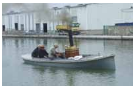
Essai à Pantin

Lundi 21 juin 2010 Deuxième essai pour cette vedette de 1904.