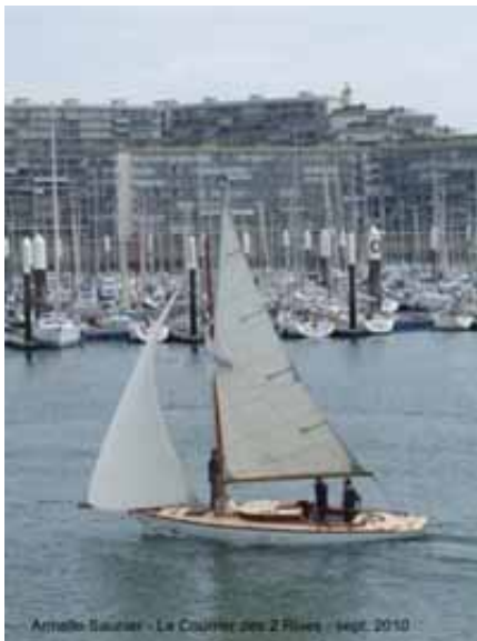
Sheena dans le bassin