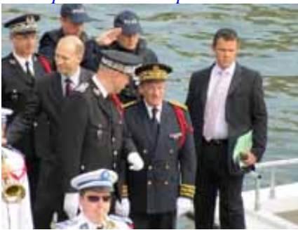
Arrivée sur le Bourgogne de Michel Gaudin, Préfet de police, Préfet de la zone de défense de Paris depuis le 25 mai 2007.