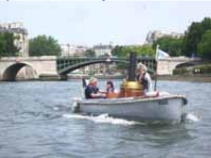
sous les ponts de Paris