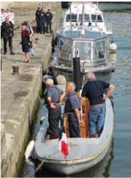
la Vigie, la plus ancienne unité, et le Morvan, celle que l'on va baptiser aujourd'hui sont amarrés quai St Bernard pour la cérémonie.