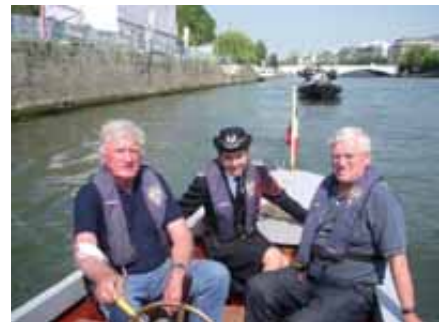
L'après-midi sera consacrée à promenades sur le fleuve