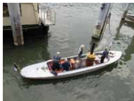
8h40, "avant lente", sortie du dock flottant pour regagner le lieu de la cérémonie