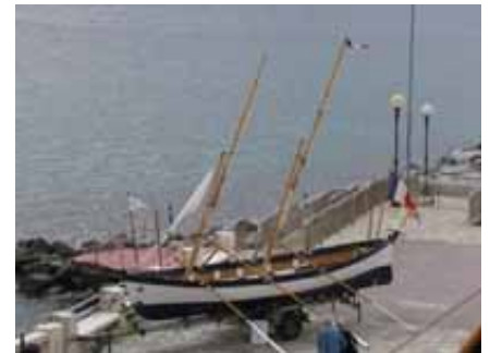
La baleinière en exposition sur le front de mer à Celle/Ligure