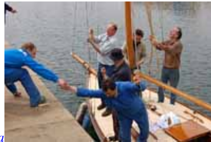
L'équipe du CMH et