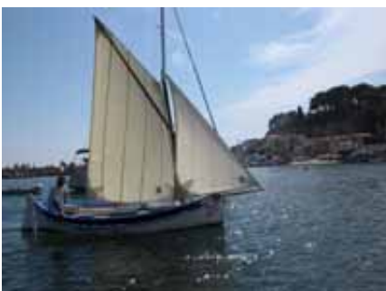
Rose Hélène entrée dans le port de Sanary

L'édition 2010, du 21 au 24 mai, a été l'occasion de voir trois unités d' AMERAMI naviguer ensemble puisque Rose Hélène , Ida et La Baleinière Amérami ont participées tant aux vire-vire sous voiles qu'à la course aux avirons pour la baleinière.