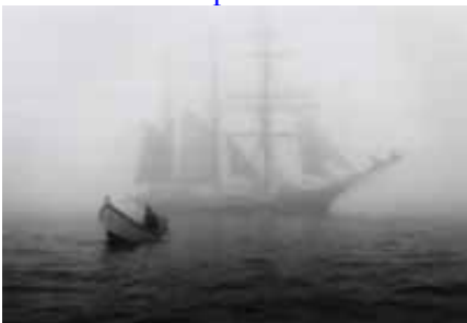
Doris et terre-neuvas dans la brume