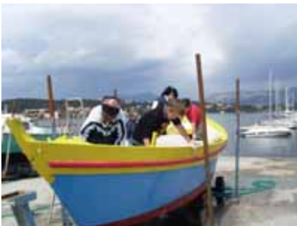
Préparation de IDA par les enfants

En projet le rassemblement de Douarnenez 2010 auquel nos amis André Guiol et Patrice Lurienne (exploitants d' IDA ), se proposent avec le concours d'une classe de La Seyne d'emmener quatre enfants. Cette action est associée à une formation d'avril à juillet au cours de laquelle les jeunes élus auront l'occasion de s'amariner lors de sorties à la mer mais ont aussi eu "droit" de participer au carénage de l'embarcation.