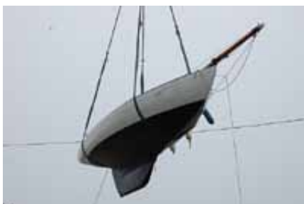
Remise à l'eau de Sheena restauré par le CMH à AMERAMI

Après une longue et lourde restauration, Sheena , dont nous avons beaucoup parlé dans notre dernière lettre est sortie du hangar du Conservatoire Maritime du Havre et a été mis à l'eau le 27 mai dernier.