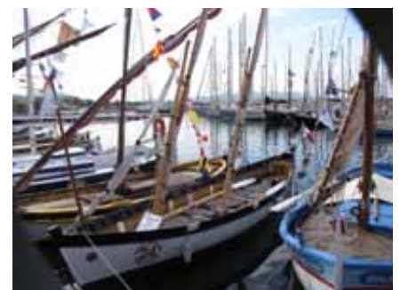
Vue des quai de Sanary lors de la Virée de Saint Nazaire avec au premier plan la baleinière

Nous en avons parlé, Douarnenez au mois de juillet pour IDA . Les rassemblements de la Rade de Toulon pour la baleinière et Ida (Saint Mandrier, Le Mourillon) et bien sûr les sorties loisir, plaisir et