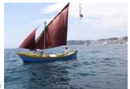
IDA à Sanary lors du Vire-vire

La "Virée de Saint Nazaire" à Sanary À noter que Sanary (San Nary) est la traduction provençale de Saint Nazaire.