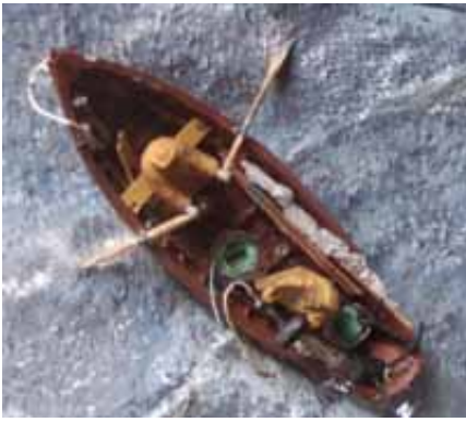
Modèle de doris et son équipage par Jean LE BOT

imposant de les changer après deux campagnes sur les bancs. Les doris ont des qualités nautiques remarquables.