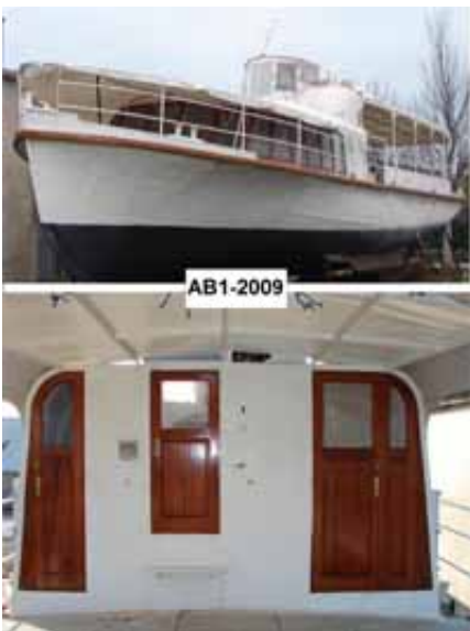
Vedette à passagers A B 1 300 Anvers sur Libération à la Cie Emeraude construite à Saint-Malo par les ateliers FORUM PLAN DES FORMES

2009: arbre de propulsion et hélice remis à neuf (Maucour à Nantes), Fenêtres du carré refaites selon l'aspect historique, portes refaites, bâtiment totalement hors d'eau.